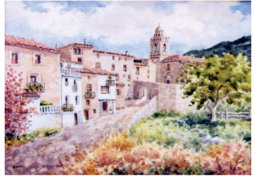
Casas de Mirambel

Exposición Florida Museum of Hispanic and Latin American Art en Miami — Exposición en París Galerie Herouet — Exposición en Frankfurt (Alemania) — Exposición Salón Internacional “Premio “Leonardo Da Vinci” — Exposición Internacional “Artexpo de New York — Invitado por Exposición Museo del Louvre (París) — Seleccionado para la 13ª Exposición del Pequeño Formato, por la Asociación Española de Pintores y Escultores de Carácter Nacional — Exposición Anual Agrupación Nacional Acuarelistas de Catalunya — Sala Caja Madrid — Invitado para la Agrupación Española de Acuarelistas de Madrid — Exposición en Centro Cultural La Moncloa (Madrid) — Miembro de Honor The Florida Museum of Hispanic Latin American Art — Su Obra figura en el Museo del Maestrazgo — Tiene Obras en varias Entidades Oficiales — Exposiciones en varias ciudades españolas. Una de sus obras figura en el Museo parroquial de la iglesia de la Natividad de Almassora.